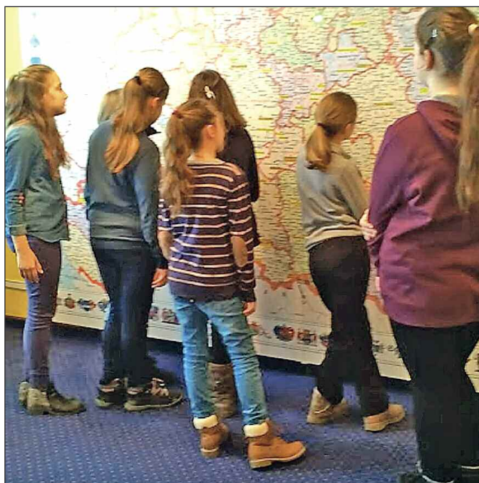
A papírmalmok egykori helyszíneit figyelik a diákok