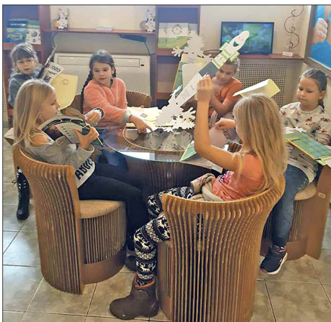
Papír Múzeumban – papírfotelban