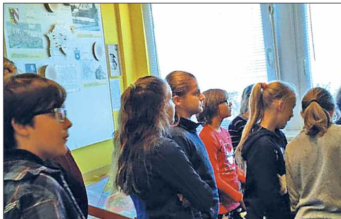
A Papírmúzeum első termében

A rajzsakkörösök november 29-én Dunaújvárosba kirándultak. Megnézték a Papírmúzeum több mint húsz termét a papírgyárban (ez egy új múzeum, nagyon érdekes, ezúton is ajánljuk mindenki figyelmébe), kipróbálták a papírmerítést, majd a Bartók Színházban Bon-bon matiné címmel a Ludas Matyi zenés-rajzos feldolgozását élvezhették.